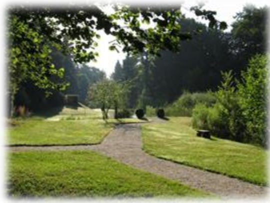
Slika 6: Botanični vrt Tal 2000