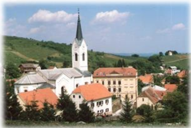
Slika 23: Cerkev Sv. Ane z južne strani