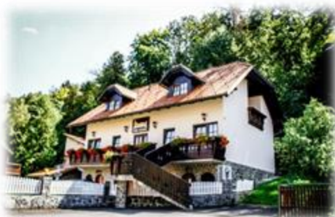
Slika 35: Framski hram

Framski hram je restavracija z znamenitim slovesom. Tradicija se je začela takoj po 1. svetovni vojni, ko so rekli: »Gremo v Špurejovo gostilno« in se je obdržala vse do danes. Danes gostom nudijo kulinarične specialitete z več kot 100-letno tradicijo, pohvalijo pa se lahko tudi z mnogimi priznanji in nagradami.