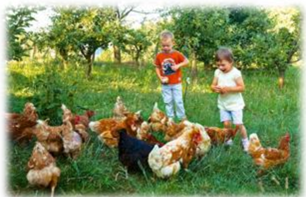
Slika 28: Otroci v pri hranjenju kokoši