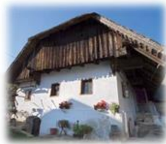
Slika 37: Vešnerjeva domačija

Stavba je tipičen etnološki spomenik, ki priča o načinu življenja skozi čas. Stavba je avtentično obnovljena in si jo je mogoče ogledati. Zgrajena je iz kamna in lesa, pokriva jo čopasta slamnata streha. Stanovanjski del hiše je podkleten s tremi obokanimi kletmi.