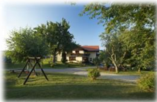
Slika 27: Kmetija in njena okolica