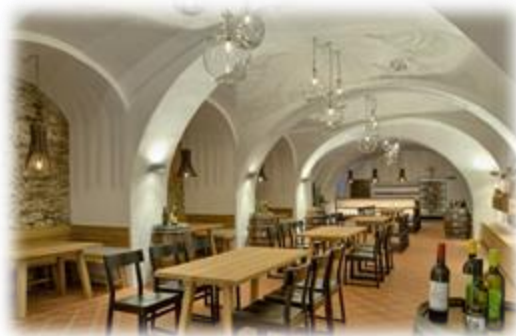
Slika 15: Degustacijski prostor v Račkem gradu