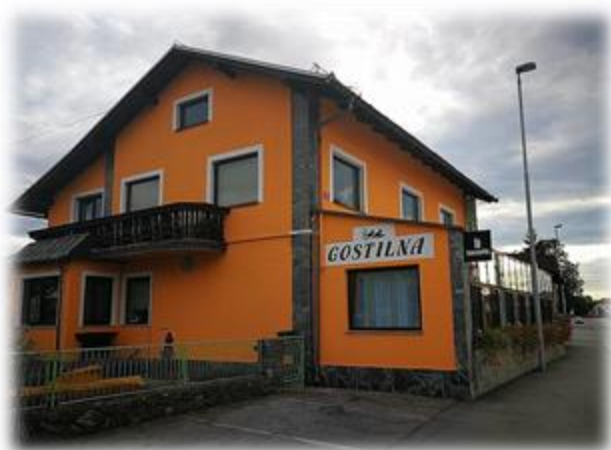
Slika 31: Gostilna Karla

Gostilna Karla ponuja svoje jedi že od leta 1908, ko je družinsko podjetje začelo vabiti goste v svojo hišo. Ponudba je zelo pestra in za vse okuse od najmlajših pa vse do najstarejših. Ponudba obsega tudi catering in ta ponudba je zelo priljubljena za poroke, obhajila, birme, rojstne dneve in druga praznovanja, ko v gostilne ni dovolj prostora. Poleg tega pa so bili že v različnih revijah zaradi svojih znamenitih chilli omak.