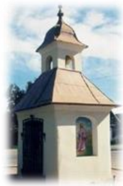
Slika 36: Kapelica v Podovi

Je pozno baročna, zaprtega tipa in zaradi svoje lege daje pomemben prostorski poudarek vaškemu trgu. Kapelico zapirajo železne kovane vratnice, v ostalih treh stranicah so polkrožno zaključene niše z mlajšo figuralno poslikavo.