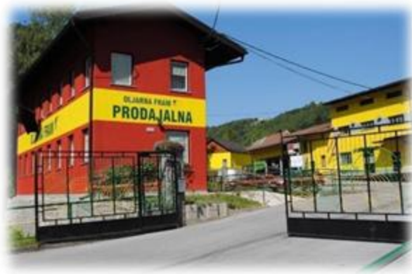
Slika 9: Oljarna Fram