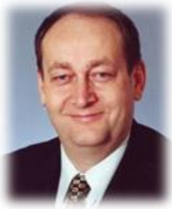
Slika 14: Župan Branko Ledinek