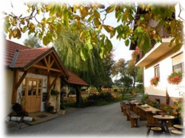
Slika 10: Turistična in bio kmetija Pri Baronu