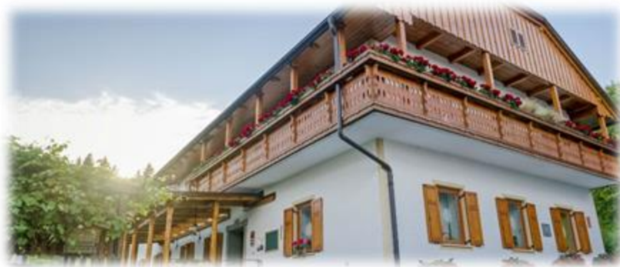
Slika 33: Pri Kovačniku

Turizem in vina Papež ponujajo domače specialitete, ki se prenašajo že tri rodove prav izpod kuhalnice babice. Poleg tega gostom nudijo domače vino iz Morja pri Framu, v svojih prostorih pa lahko sprejmejo tudi večje skupine.