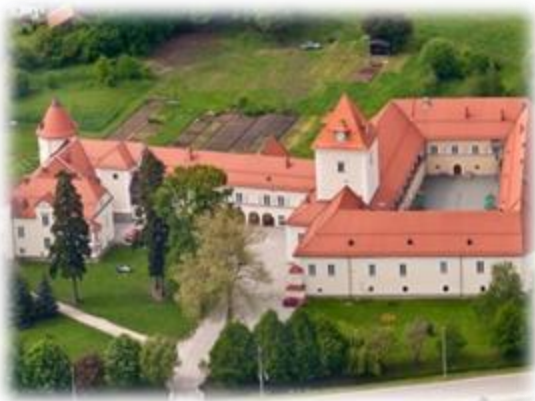
Slika 13: Grad Rače iz zraka