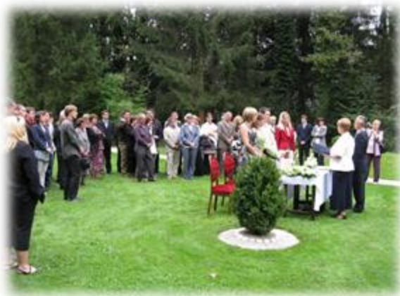
Slika 20: Poroka v botaničnem vrtu Tal 2000