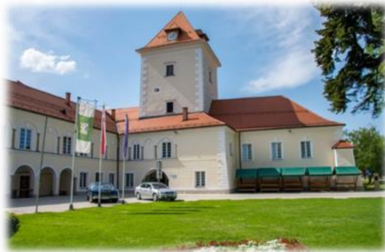
Slika 2: Grad Rače

Danes je grad v lasti občine Rače-Fram. Če nanj pogledamo iz zraka lahko opazimo, da je prav umetniško zasnovan saj ima obliko ključa, ki si jo lahko ogledamo tudi na maketi v samem gradu. Danes se v gradu nahaja sedež občine, Bela dvorana, Grajska kapela, Turistična agencija Pozejdon turizem in Grilova etnološka zbirka. Med drugim je Rački grad imeniten kraj za poroko, to pa lahko potrdijo mnogi pari, ki so se poročili prav tukaj.