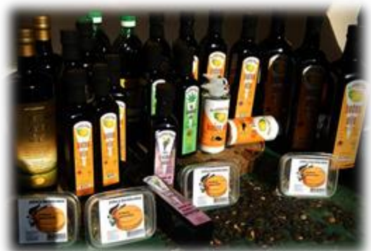
Slika 25: Proizvodi Framske oljarne