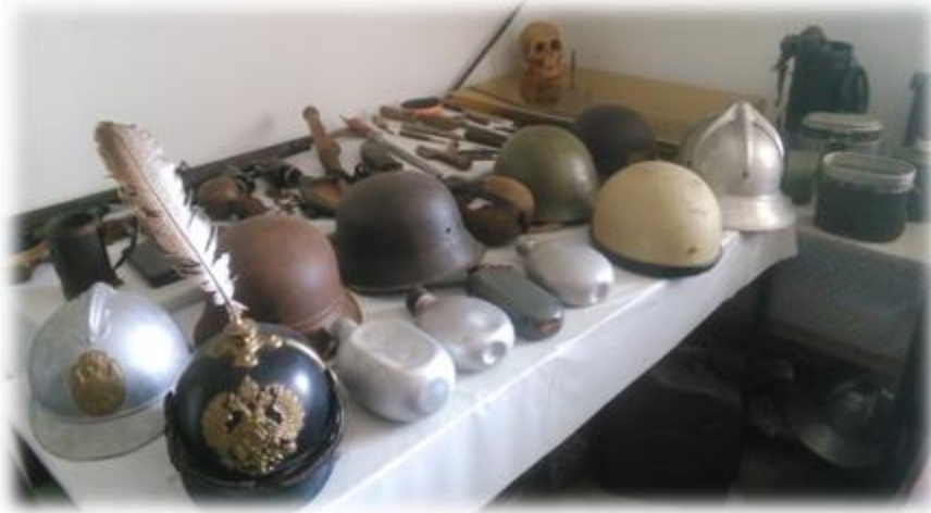
Slika 3: Grilova etnološka zbirka

se je zbiranje predmetov v družini Gril nadaljevalo iz roda v rod. Kaj kmalu so imeli toliko predmetov, da jim je zmanjkovalo prostora, nakar jim je župan občine podelil prostor v gradu, kjer se Grilova zbirka nahaja še danes. Do danes so tako zbrali več kot 4500 eksponatov, ki si jih lahko ogledate. Imajo vse od starih šivalnih strojev, potnih listov, predmetov iz 1. in 2. svetovne vojne pa vse do najdragocenejših, kot so relikvije pomembnih pokojnih duhovnikov.