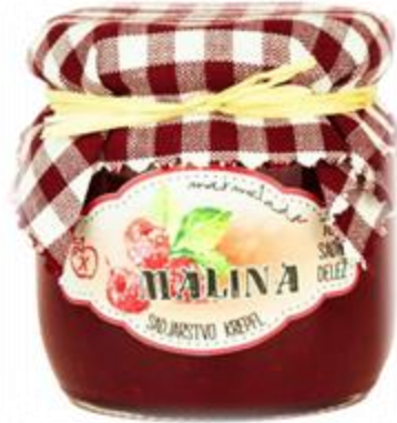
Slika 29: Eden od izdelkovi sadjarstva Krepfl

V Račah in okolici je veliko domačih pridelovalcev med te spada tudi pridelovalec jabolk in jabolčnega soka in kisa - Sadjarstvo Krepfl. Ponuja zelo pestro ponudbo domačih jabolčnih izdelkov, ki jih ne samo prodaja v Račah na tržnici ampak tudi v Mariboru v prodajalni E.Leclercu.