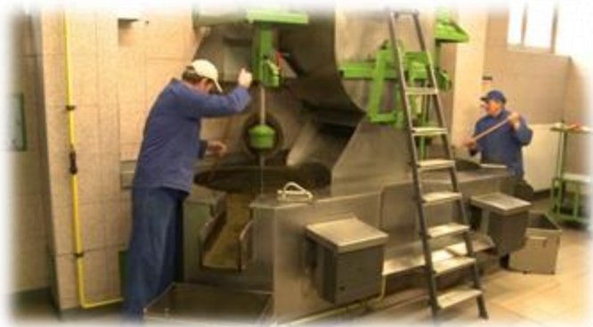
Slika 26: Delo v Oljarni Fram