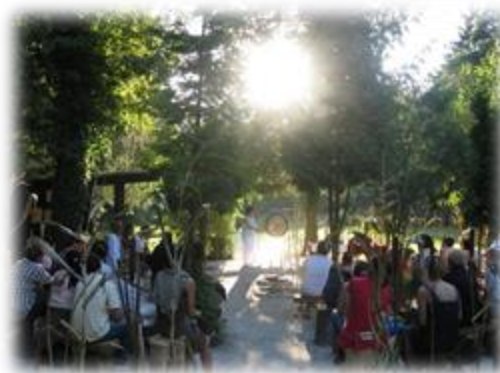
Slika 19: Dogodki v botaničnem vrtu Tal 2000