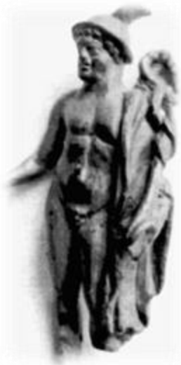
Slika 16: Kipec Merkurja