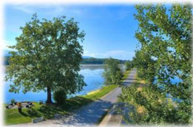
Slika 7: Krajinski park Rački ribniki - Požeg