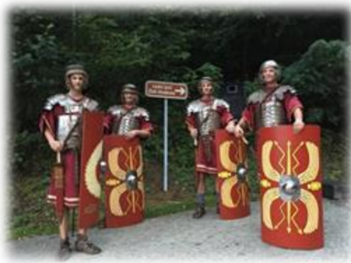
Slika 38: Rimski legionarji varujejo studenec

Danes je izvir Zlati studenec usahel, vendar je kot začetna točka veličastnega gradbenega dela rimskih graditeljev enkratni spomenik kulturne dediščine. Prve omembe arheološke najdbe segajo v konec 19. stoletja.