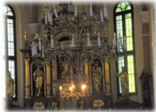
Slika 24: Cerkev znotraj