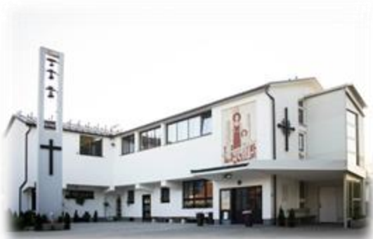
Slika 18: Cerkev Sv. Jožefa Delavca zunaj