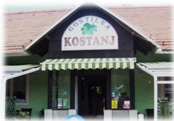
Slika 32: Gostilna Kostanj

Gostilna Kostanj sprejema večje skupine in delavcem nudi malice, ter kosila za zaključene družbe. Ponuja pa pestro ponudbo glavnih jedi in predjedi.