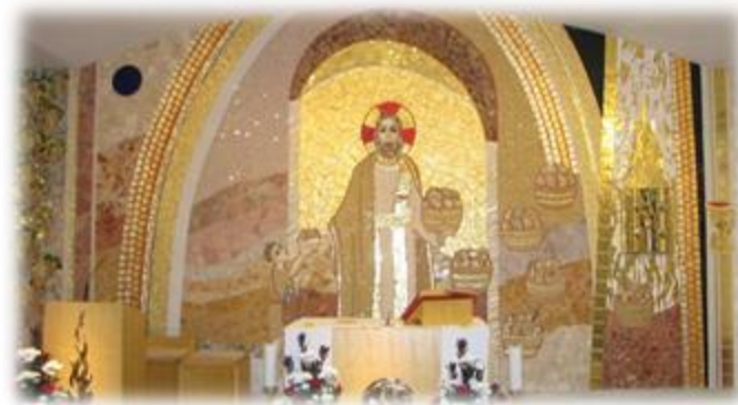
Slika 5: Župnijska cerkev Sv. Jožefa Delavca