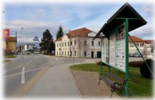
Slika 11: Občina Rače - Fram