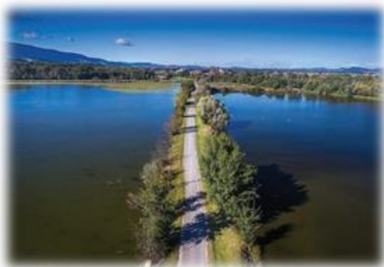
Slika 21: Krajinski park iz zraka