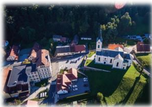
Slika 8: Župnijska cerkev Sv. Ane

Stara poročila vedo povedati, da sta starša peljala Marijo še čisto mlado v tempelj, jo Bogu darovala, kakor sta se bila zaobljubila, in jo v Jeruzalemu dala v tempeljski zavod za deklice, sama pa sta se vrnila domov. Kako sta se potem veselila tistih dni, ko sta vsako leto za tri velike judovske praznike romala v Jeruzalem, da bosta spet videla svojo drago hčer. Beseda Ana pomeni po slovensko »milina«.