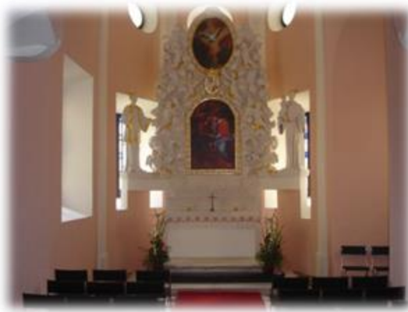
Slika 4: Grajska kapela