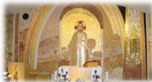
Slika 17: Cerkev Sv. Jožefa Delavca znotraj