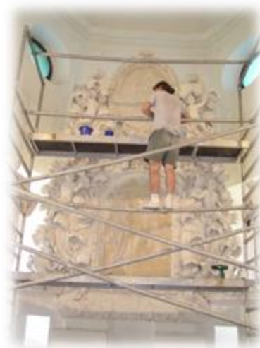
Slika 12: Grajska kapela med prenovo