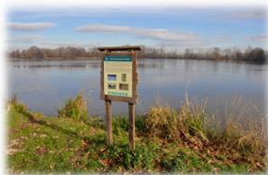
Slika 22: Informativne table v parku