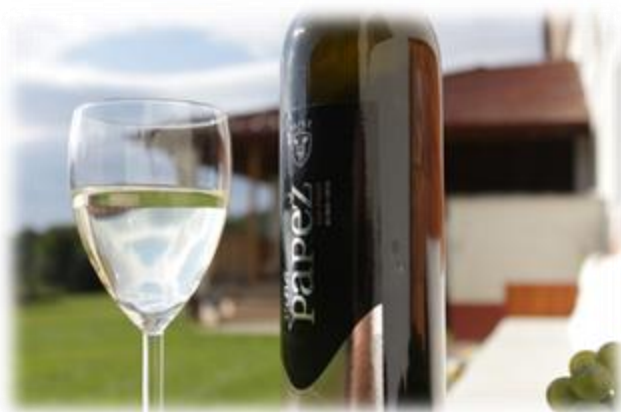
Slika 34: Vina in turizem Papež

Turizem in vina Papež ponujajo domače specialitete, ki se prenašajo že tri rodove prav izpod kuhalnice babice. Poleg tega gostom nudijo domače vino iz Morja pri Framu, v svojih prostorih pa lahko sprejmejo tudi večje skupine.